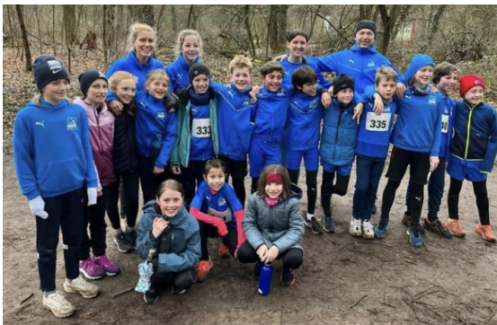
35 Medaillen bei den Rheinhessen-Meisterschaften.