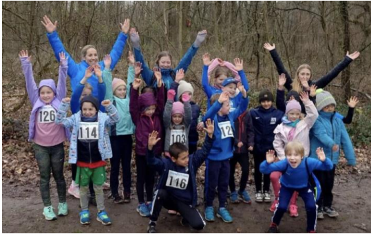
Jubel bei den Cross-Läufern des TSV SCHOTT über